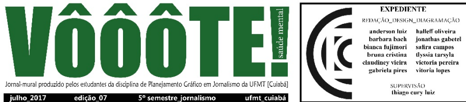
Imagem 1: Edição nº 7

Pró-Reitoria de Assistência Estudantil da UFMT cria projetos de apoio emocional para estudantes Iniciativa surge em virtude da ocorrência de casos extremos [anderson luiz_gabriela pires_safira campos]